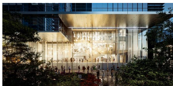
劇場ホワイエ（外堀通り側）